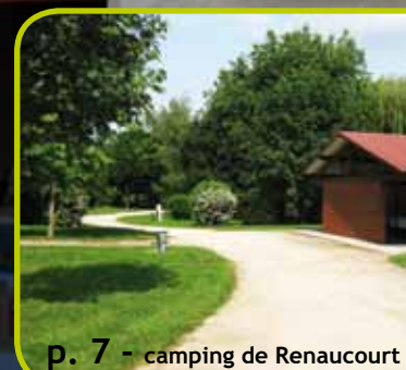
p. 7 - camping de Renaucourt