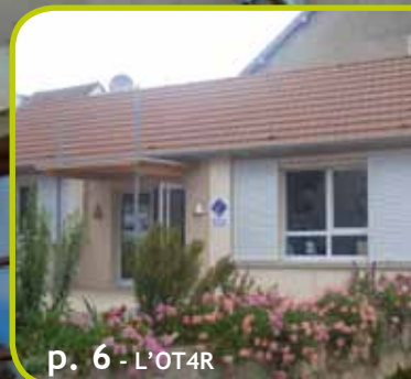
p. 6 - L'OT4R