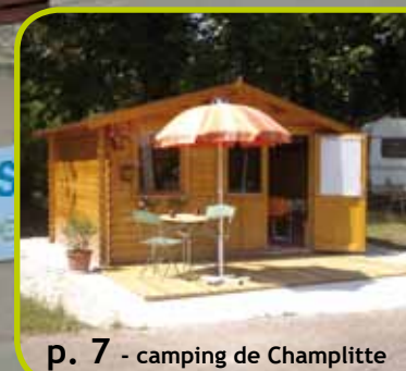
p. 7 - camping de Champlitte