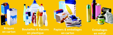
Briques en carton, Bouteilles & flacons en plastique, Papiers & emballages en carton, Emballages en métal